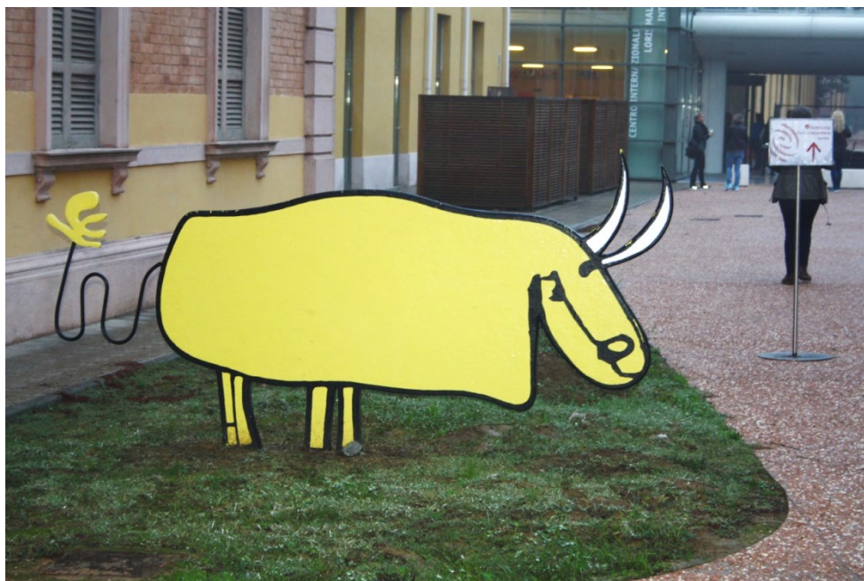
Fra inngangspartiet til Loris Malaguzzi Internasjonale Center.