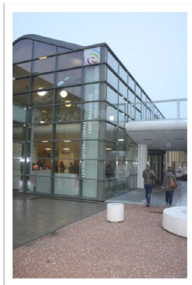
Til venstre et glimt inn i en av de små gatene som plutselig gir utsyn til en av kirkenes kuppel, og til høyre inngangspartiet til Loris Malaguzzi Internasjonale Center.