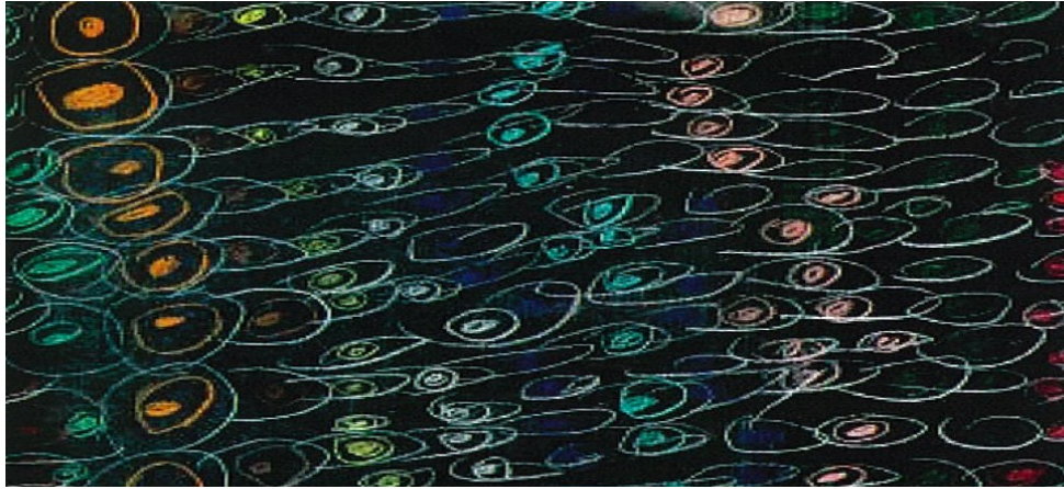
«Froskens hud» hentet med tillatelse fra Stefano Sturloni, barnehagen Salvador Allende, Reggio Emilia, fra prosjektet «Raneria» - Froskerier, presentert på kurs i Sola Kulturhus og Verkstedhallen Svartlamon, mars 2013.