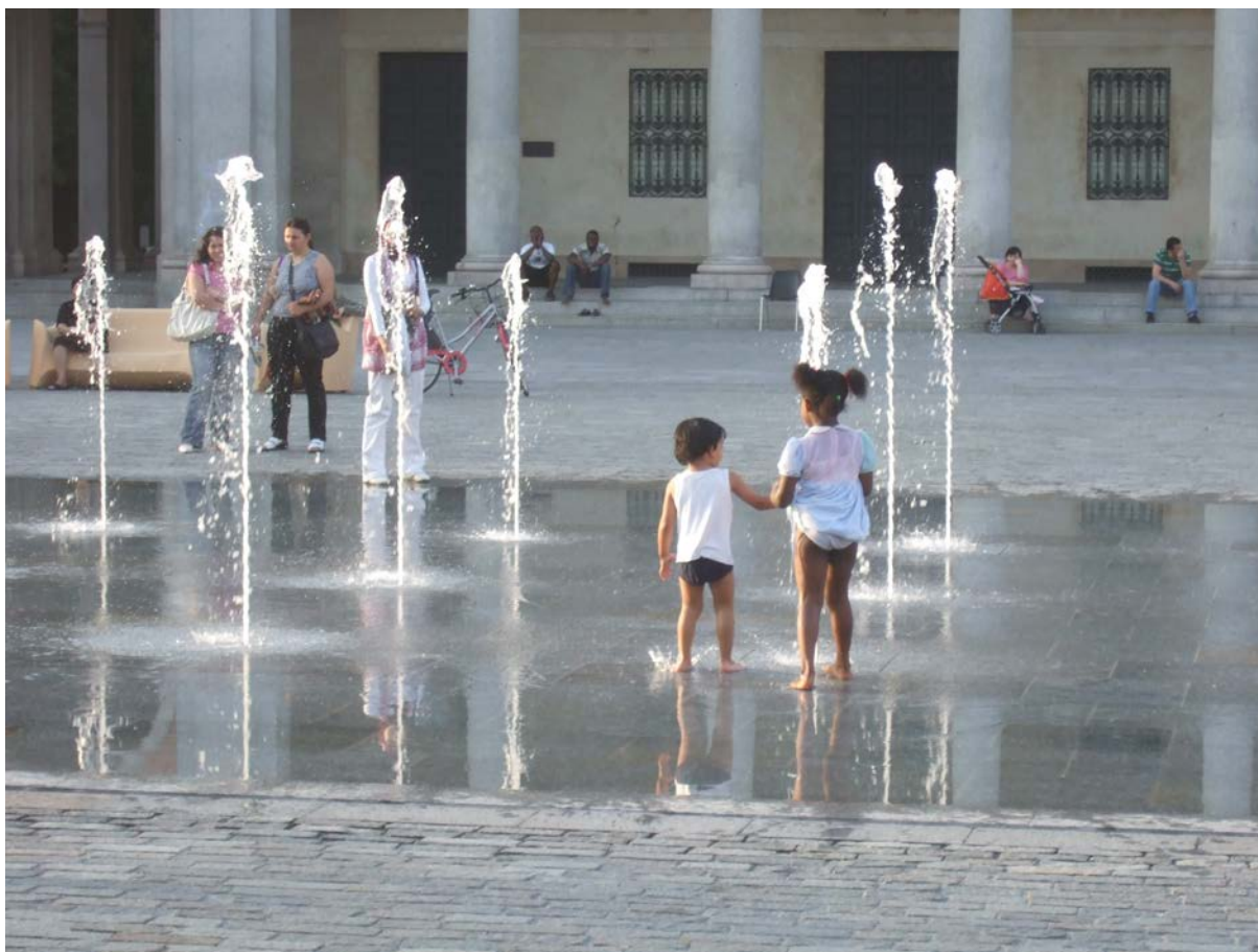
Torget foran Teatro Ariosto med den nye fontenen, sommer 2010